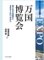
『万国博覧会:知られざる歴史とSDGsとのつながり』 (稲葉茂勝・渡邊優著, ミネルヴァ書房)