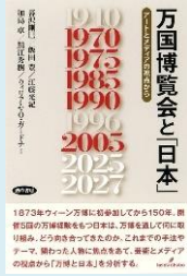
『万国博覧会と日本:アートとメディアの観点から』 (暮沢剛己 他著, 勁草書房)