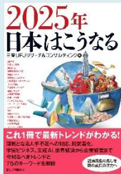
『2025年日本はこうなる』 (三菱UFJリサーチ&コンサルティング編, 東洋館新報社)