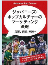
『ジャパニーズ・ポップカルチャーのマーケティング戦略』 (川又啓子 他編, 千倉書房)