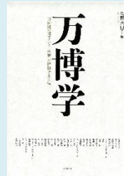
『万博学:万国博覧会という、世界を把握する方法』 (佐野真由子編, 思文閣出版)