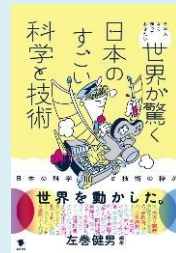
『世界が驚く日本のすごい科学と技術』 (左巻健男編著, 笠間書院)