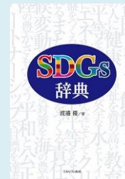
『SDGs 辞典』 (渡邊優著, ミネルヴァ書房)