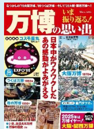
『いま振り返る!万博の思い出』 (五月女賢司監修, 宝島社)