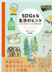
『SDGsな生活のヒント:あなたの物の使い方が地球を救う』 (トラ・シャイン著, 創元社)