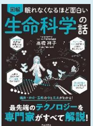
『眠れなくなるほど面白い 図解 生命科学の話』 (高橋祥子著, 日本文艺社)