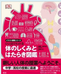
『ひと目でわかる体のしくみとはたらき図鑑』 (大橋順・桜井亮太監修, 創元社)