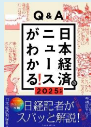
『Q&A 日本経済のニュースがわかる! 2025年版』 (日本経済新聞社編, 日経DP)