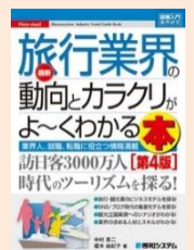
『旅行業界の動向とカラクリがよ〜くわかる本』 (中村恵二他著, 秀和システム)