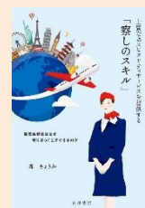
『上質なホスピタリティサービスを提供する「察しのスキル」』 (森さようか著, 見洋書房)