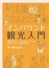
『インバウンド観光入門』 (矢ヶ崎紀子著, 見洋書房)