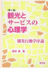
『観光とサービスの心理学』 (前田勇著, 学文社)