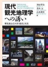
『現代観光地理学への誘い』 (神田孝治他編, ナカニシヤ出版)