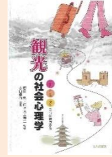
『観光の社会心理学』 (小川孝司編著, 北大路書房)