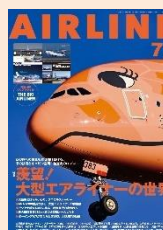
『月刊エアライン』 (イカロス出版者, イカロス出版)