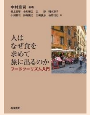
『人はなぜ食を求めて旅に出るのか』 (中村忠司編著, 見洋書房)