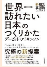
『世界一訪れたい日本のつくりかた』 (デービッド・アートキンソン著, 東洋経済新報社)