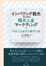
『インバウンド観光のための観光土産マーケティング』 (辻本法子著, 同文館出版)