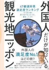
『外国人だけが知っている「観光地ニッポン」』 (スズファン・シャウエンカー著, 大和書房)