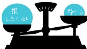
プロスペクト理論の例